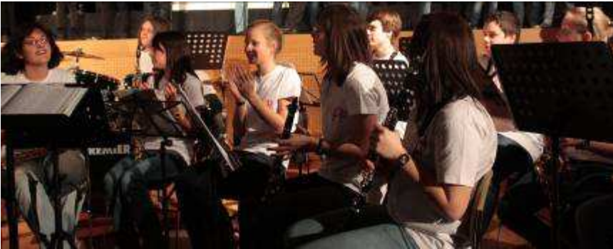
Concert Januar 2011: Section F & friends LCD Chorale &