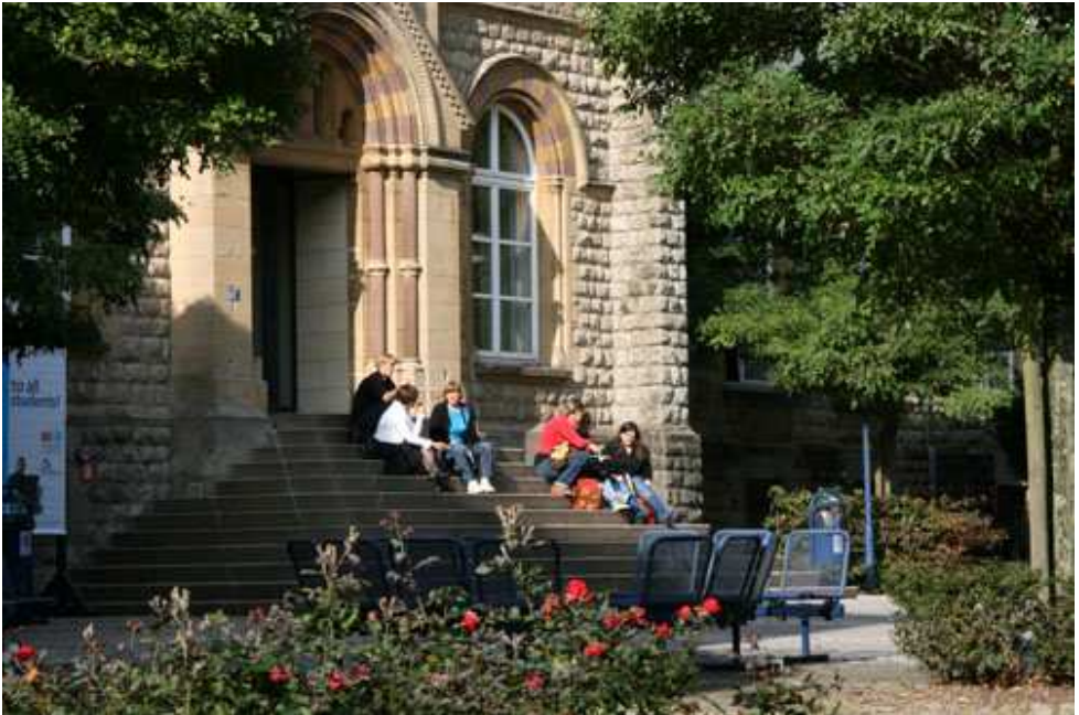
Uni.lu Campus Limpertsberg