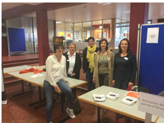
Portes ouvertes LCD - Présence de l'APE

Dann ginn et nach Siten um Internet wou dir Nohëllef an alle Fächer an op allen Niveauen kennt fir all Schüler ufroen, hei e puer Beispiller: www.Studyfox.lu , www.intellego.lu , www.nohellef.com , www.eilchen.lu , etc.