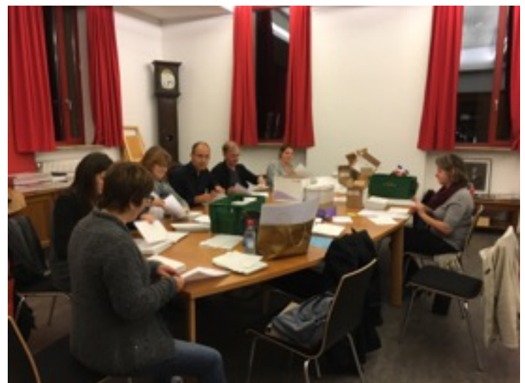
Photo : l'APE à l'oeuvre pour envoyer les invitations à l'assemblée générale

Tenez à l'oeil notre futur courrier qui vous invitera à une soirée-conférence où nous fêterons ensemble ces 40 ans de collaboration avec les différents membres du lycée.